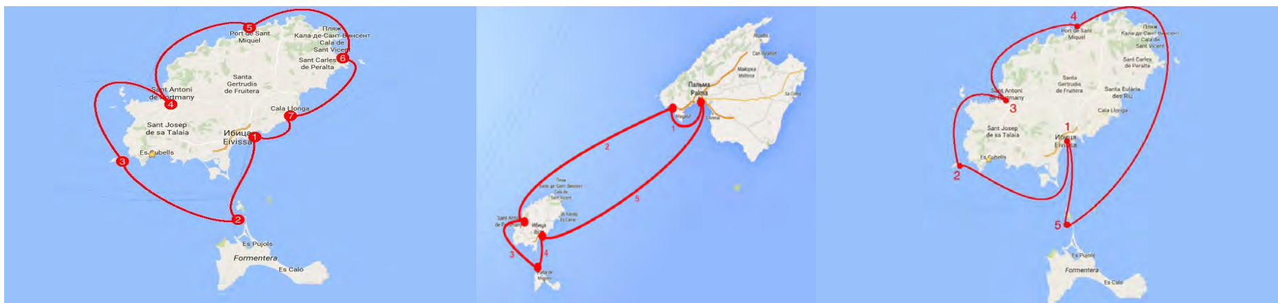
Пример маршрута: Eivissa (столица острова) — о. Форментера (пляж) — Es Vedra (скала) — San-Antonio (город на севере) — San Miguel (красивая бухта) — Santa Eulalia (город) — Cala Llonga (красивая бухта) — Eivissa.

Заработок агентства — 1900 Евро, ведь цена тура от Sail Me — 2900 Евро.